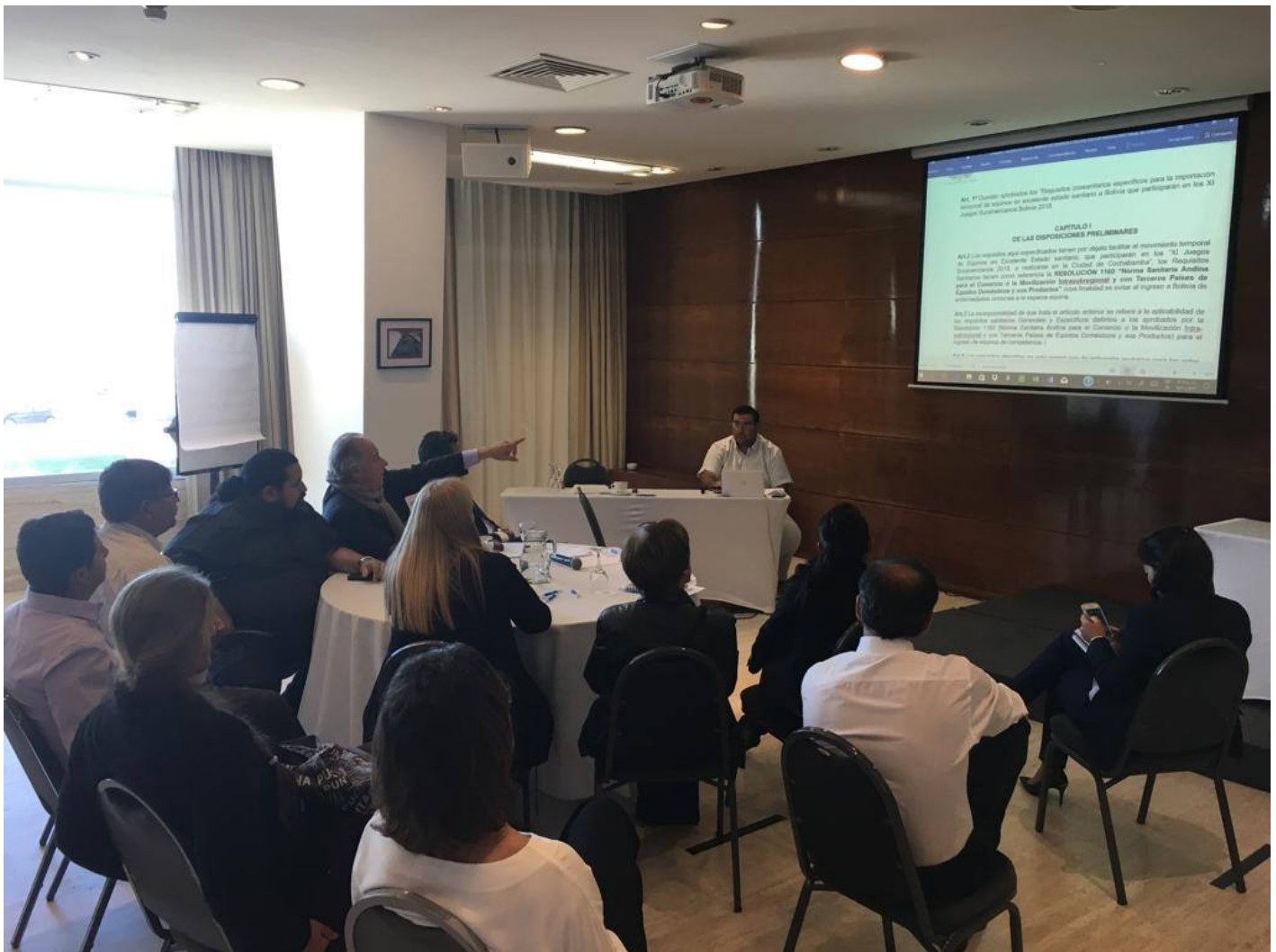
Travail de groupe lors d'un atelier OIE/IHSC (Montevideo, Uruguay, 2017).