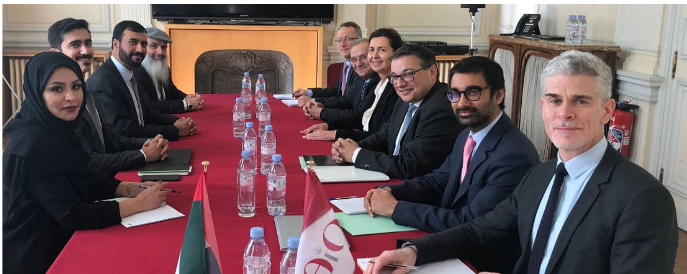
Réunion au Siège de l'OIE, 21 février 2019